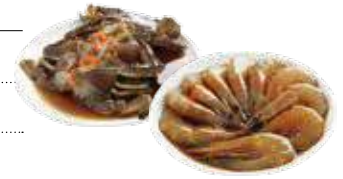
꽃게장 400g / 500g(2마리) 38,600 / 47,000 대하장 400g(간장포함 900g) 24,800

! 건고추, 고춧가루 주문은 9월 초에 예정되어 있습니다. 추후 안내하겠습니다.