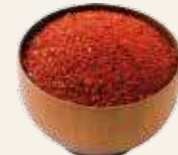
양념용 2kg / 장용 1kg

※ 한살림생산자가 정성스레 키운 유기고추를 가공한 물품입니다. ※ 건고추 수매상황에 따라 가격이 변동될 수 있습니다.